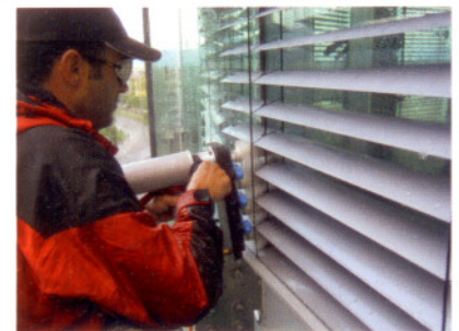
Je nach Lamellenbreite wird der Abstand der Walzenbürsten am Jalousienreinigungsgerät AJR professional zueinander einfach verändert bzw. durch den Einsatz entsprechend langer Bürsten die Reinigung optimiert.

Bei der Reinigung mit diesem Gerät werden die rotierenden Walzenbürsten des Handmoduls unter Zuleitung von Wasser entlang der waagrecht gestellten offenen Sonnenschutzanlagen bewegt, je nach Art des Reinigungsvorgangs von