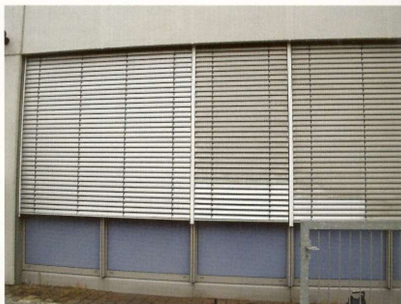
Pfiffige Maschine: Mit der AJR professional werden bei der Reinigung von Lamellen zwischen 50 und 80 Prozent an Arbeitszeit gespart.