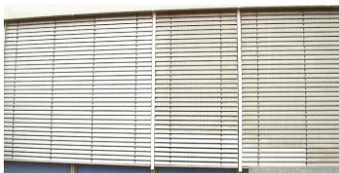
Bis zu 40m 2 stündlich lassen sich mit der AJR professional reinigen