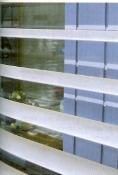
Maschinelle Reinigung von Außenjalousien

nehin nicht mitgereinigt werden können. Hinzu kommt, dass es in der Vergangenheit zunehmend Reklamationen gegeben hat, da auf Grund unsachgemäßer Behandlung durch das Reinigungspersonal Lamellen beschädigt wurden.