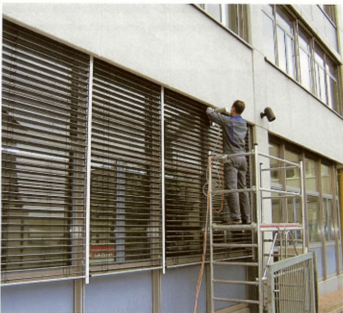
▲ Hauswasser- und 230 Volt Stromanschluss genügen. Für jede Lamellenbreite gibt es ein passendes Getriebe.

Hersteller: sps-cleaning-systems, Ehmann und Frey GbR, Ohmstr. 30, D-70736 Fellbach, www.sps-cleaning.net ■