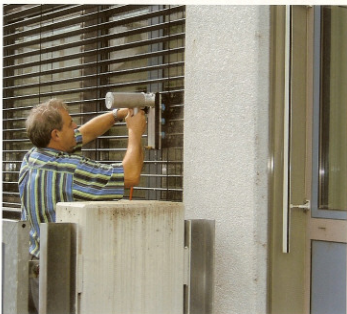
▲ Das mobile System wird von einer Person mühelos bedient.