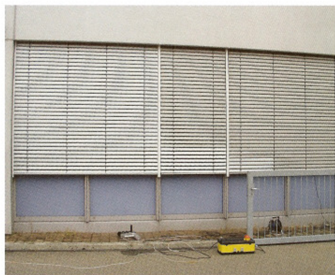
Das Reinigungsergebnis macht der Vorher-nachher-Vergleich deutlich.