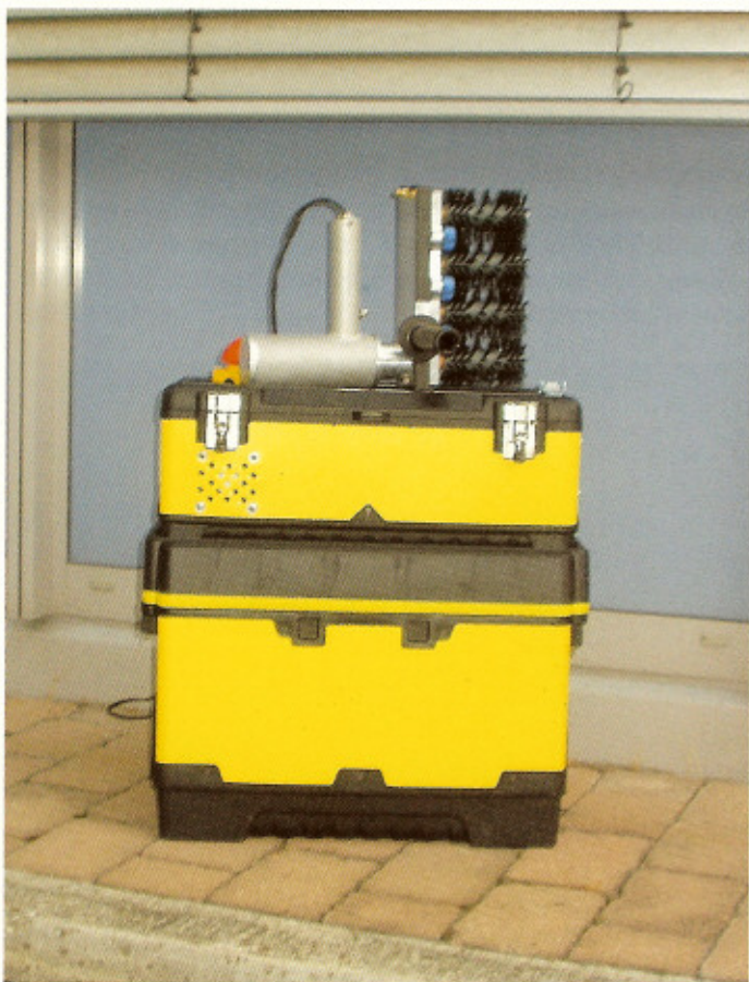
Leichter Transport durch einen praktischen Transportkoffer.

Nach den ersten Einsätzen kann man sagen, dass die AJR 80 eine gründliche, materialchonende und umweltfreundliche (ohne Einsatz von Chemie) Reinigung von Außenjalousien am Objekt ermöglicht. Da auch noch Zeit- und damit Personalkosten reduziert werden, ist AJR professional sicherlich mehr als nur eine Alternative in der Unterhaltsreinigung von Außenjalousien. Der Grundpreis für die Maschine liegt bei 5750,00 Euro zuzüglich Mehrwertsteuer. □